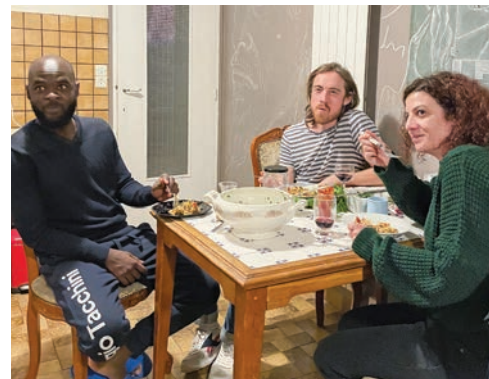
Le pavillon de la rue Gilbert-Hanot accueille de jeunes actifs précaires et des personnes récemment arrivées sur le sol français.

TRANSFORMER DES LIEUX VIDES en lieux de vie. Tel est l'objet de l'association francilienne Caracol, qui met son savoir-faire au service de projets d'occupation temporaire à but d'habitat solidaire. À Bobigny, Caracol a signé une convention avec la Société du Grand Paris qui avait, en 2019, racheté un pavillon à son propriétaire, rue Gilbert-Hanot. Une acquisition effectuée dans le cadre du chantier de la future ligne 15 du métro. En attendant le démarrage des travaux, cette maison vide est du coup devenue un espace de colocation solidaire, avec de jeunes actifs précaires et des personnes récemment arrivées sur le sol français. « Notre association a