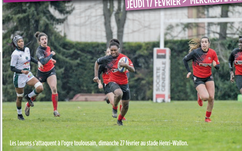
Les Louves s'attaquent à l'ogre toulousain, dimanche 27 février au stade Henri-Wallon.