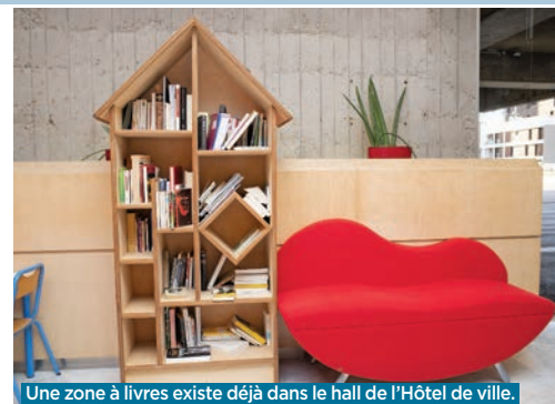
Une zone à livres existe déjà dans le hall de l'Hôtel de ville.