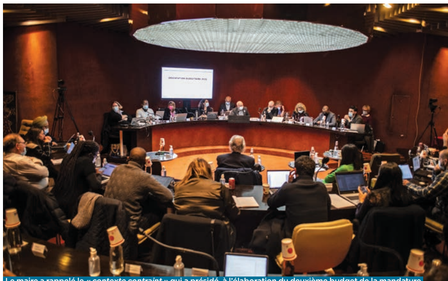
Le maire a rappelé le « contexte contraint » qui a présidé à l'élaboration du deuxième budget de la mandature.

Le secteur de l'éducation se taille la part du lion avec 4,9 M€ en fonctionnement.