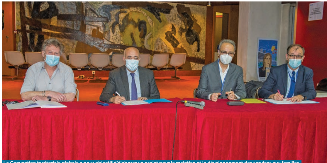
La Convention territoriale globale a pour objectif d'élaborer un projet pour le maintien et le développement des services aux familles.

LE 8 FÉVRIER DERNIER , dans le salon d'honneur de la mairie, la Ville et la Caisse d'allocations familiales de Seine-Saint-Denis (CAF 93) ont paraphé une nouvelle Convention territoriale globale (CTG). Ce document stratégique a pour objectif d'élaborer un projet pour le maintien et le développement des services aux familles, avec la mise en place de toute une série d'actions favorables aux allocataires. Les CAF complètent ainsi les politiques municipales, en participant au financement de multiples actions dans les territoires, dans des domaines aussi divers que l'accès aux droits, le handicap, l'inclusion numérique, la petite enfance, la pa-