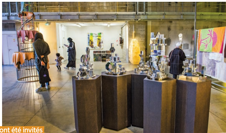
Les artistes ont été invités à concevoir des œuvres en soie, en cristal, en argent ou en cuir.