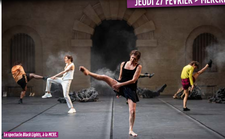
Le spectacle Black Lights, à la MC93.

BOURSE DU TRAVAIL. L'ÉCRAN NOMADE ★ Petites Mains de Nessim Chickaoui (P. 12). Révolte chez les femmes de chambre d'un grand hôtel. Dans le cadre de la Journée internationale des droits des femmes. 10 h. Séance offerte par la Ville.