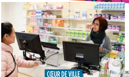
CEUR DE VILLE