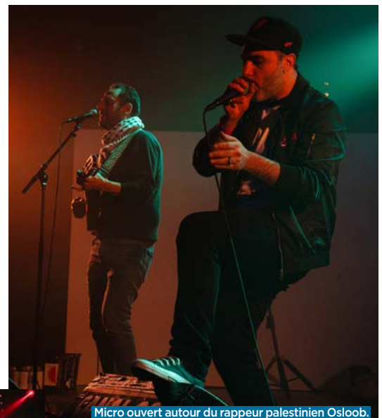
Micro ouvert autour du rappeur palestinien Osloob.