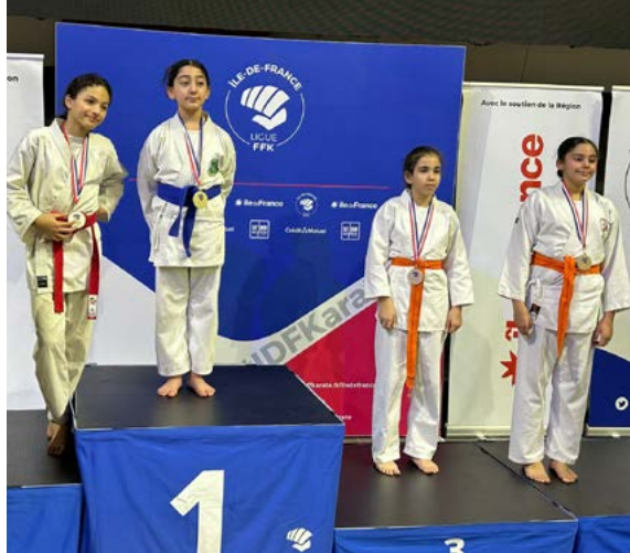
Le Sporting Club a trûsté les podiums des championnats d'Île-de-France.

LE MOIS DE FÉVRIER, RÉSERVÉ AUX COMPÉTITIONS RÉGIONALES, a une nouvelle fois prouvé la valeur de la qualité de la formation au Sporting Club de Bobigny. Avec pas moins de dix-huit podiums aux championnats d'Île-de-France, les karatékas balbyniens ont fait briller les couleurs vert et jaune de leur club, se qualifiant par la même occasion pour les championnats de France de leurs catégories d'âge.