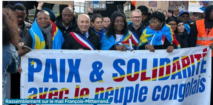
Rassemblement sur le mail François-Mitterrand.

L'ASSOCIATION BALBYNIENNE BOMOYI a organisé, samedi 22 février sur le mail François-Mitterrand, un rassemblement de soutien avec le peuple congolais et d'appel à la fin de la guerre qui se déroule à l'est de la République démocratique du Congo (RDC). « Depuis des décennies, les populations de l'est de la RDC subissent les affres de la guerre, les pillages, les viols et les massacres orchestrés par des groupes armés bénéficiant de soutiens extérieurs », rappelle le PCF dans un communiqué, en date du 27 janvier dernier, dans lequel il exprime « sa profonde préoccupation face à la détérioration alarmante