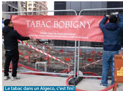
Le tabac dans un Algeco, c'est fini!

En tous les cas, une large banquette permettra aux personnes âgées de pouvoir patienter assises en cas d'affluence. L'officine dispose aussi d'un espace vaccin et d'un autre dédié à l'accueil de confidentialité. Comme l'aménagement des espaces publics du