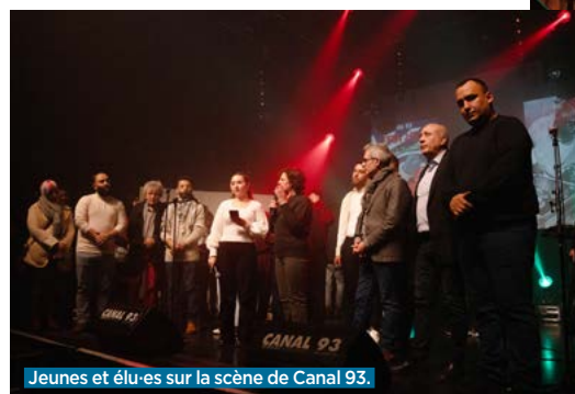
Jeunes et élu-es sur la scène de Canal 93.