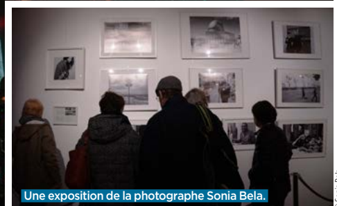
Une exposition de la photographe Sonia Bela.