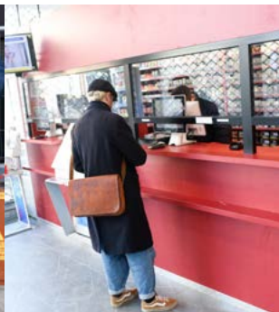
La nouvelle boutique de la pharmacie.