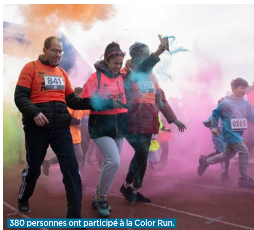
380 personnes ont participé à la Color Run.

Bobigny a accueilli la Color Run , une course inclusive de 5 km où les coureurs se font, tout le long du parcours, arroser de poudre de toutes les couleurs.