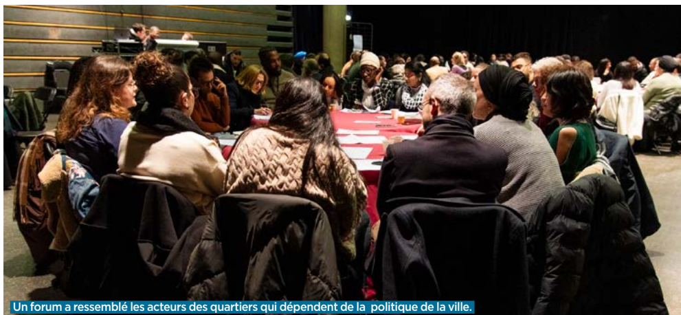
Un forum a rassemblé les acteurs des quartiers qui dépendent de la politique de la ville.

Réuni-es en forum début février, représentant-es d'associations et d'administrations ont présenté leurs projets en vue d'obtenir des subventions de la politique de la ville.